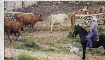
Rebaño fuera y dentro. En apenas veinte minutos, el 'cowboy' guió todo un grey de vacas dentro del cercado. El de Arizona dejó claras sus dotes de vaquero en Son Angel, ante el entusiasmo de los allí presentes.