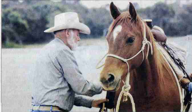
Mira, escucha, toca, oye y siente. El adiestramiento de Harris destaca por la 'finezza' en su trato con el equino.